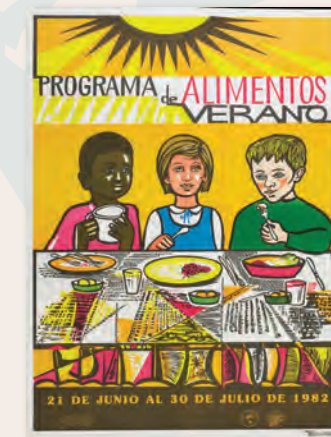
"Programa de Alimentos de Verano" (Summer Nourishment Program) José Antonio Ortiz, 1982 Puerto Rico Division of Community Education Poster Collection, Archives Center, National Museum of American History, Smithsonian Institution

Carefully observe the two posters below and answer the following questions with your partner. Be ready to share with the rest of the group.