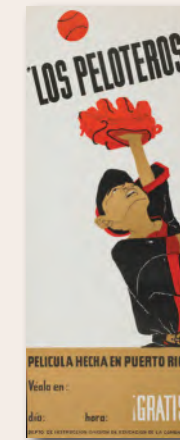
"Los Peloteros (The Baseball Players)" Lorenzo Homar, 1961 Puerto Rico Division of Community Education Poster Collection, Archives Center, National Museum of American History, Smithsonian Institution

1. ¿Qué asuntos o temas crees que se discuten en estos dos carteles? ¿Qué te hace pensar eso? Sé específico.