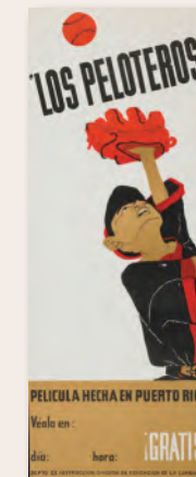
"Los Peloteros (The Baseball Players)" Lorenzo Homar, 1961 Puerto Rico Division of Community Education Poster Collection, Archives Center, National Museum of American History, Smithsonian Institution